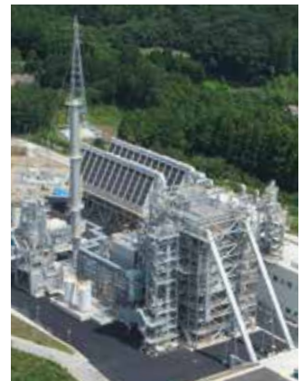
エフオン豊後大野